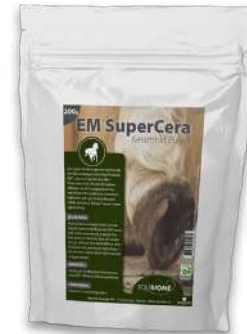
EM Super Cera 200g