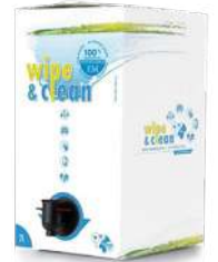
Wipe & Clean finns i 2l och 20l